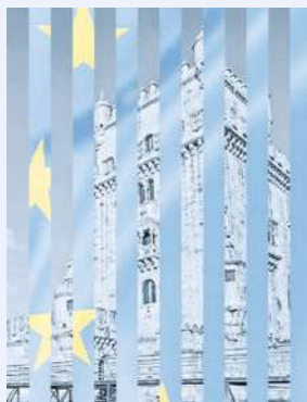
Der 35 Meter hohe Torre de Belém in Lissabon war bis ins 19. Jahrhundert ein Gefängnis und Waffenlager.

HÉLIA CORREIA (67) ist portugiesische Schriftstellerin, deren Werk von Romanen über Dramen bis zu Gedichten reicht. 2015 erhielt sie den Prémio Camões, den wichtigsten Literaturpreis der portugiesischsprachigen Welt. Sie lebt in Lissabon.