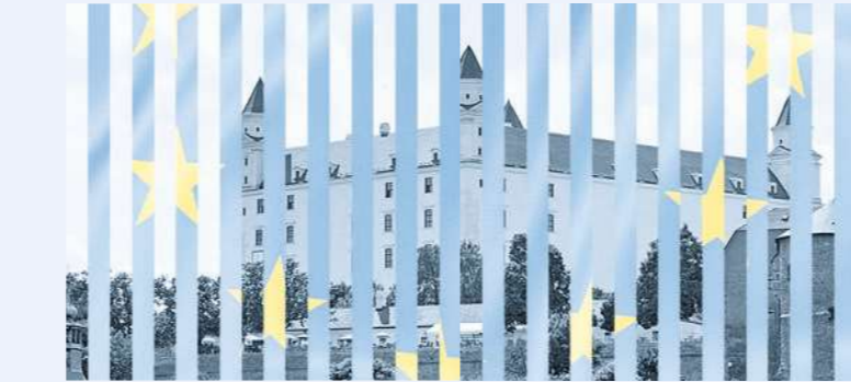
Die viertürmige Burg Bratislava thront auf einem Felsen 85 Meter über dem linken Ufer der Donau. Unter den Habsburgern war die Stadt Pressburg zeitweilig Hauptstadt des Königreichs Ungarn.

Manchmal lachen ich und meine Ehefrau darüber, aber letztlich eher selten. Ich kann damit nicht gelassen umgehen. Oft bin ich sprachlos, und, ich gebe zu, auch beängstigt. Ich weiß, dass sich die Gegner gerade das wünschen, aber mir fehlt