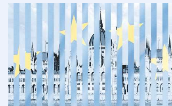
Das ungarische Parlamentsgebäude, das sich in Budapest über 268 Meter entlang der Donau erstreckt, hat so viele Türmchen wie ein Jahr Tage – es sind 365.