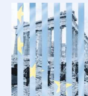
Die Akropolis in Athen ist der Stadtgöttin Athene gewidmet und war erst Sitz der Könige, später Sitz der Götter.

In dieser Verwandlung gibt es sowohl eine erschaffende als auch eine auflösende